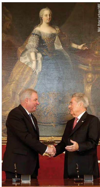
Bundespräsident Heinz Fischer beglückwünschte Landeshauptmann Hermann Schützenhöfer.

In feierlicher Atmosphäre in der Wiener Hofburg wurde Hermann Schützenhöfer am Tag vor der ersten