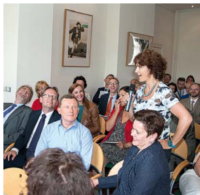
Mitglieder des österreichischen Managernetzwerks in der „Frage/Antwort Session“ mit Vizepräsidentin Georgieva

auch für die EU-Institutionen und ihre Mitarbeiter. Die wichtigste Priorität der Juncker-Kommission für die nächsten fünf Jahre sei es, Investitionen in der EU zu steigern, um so schnell wie möglich die Krise zu überwinden und