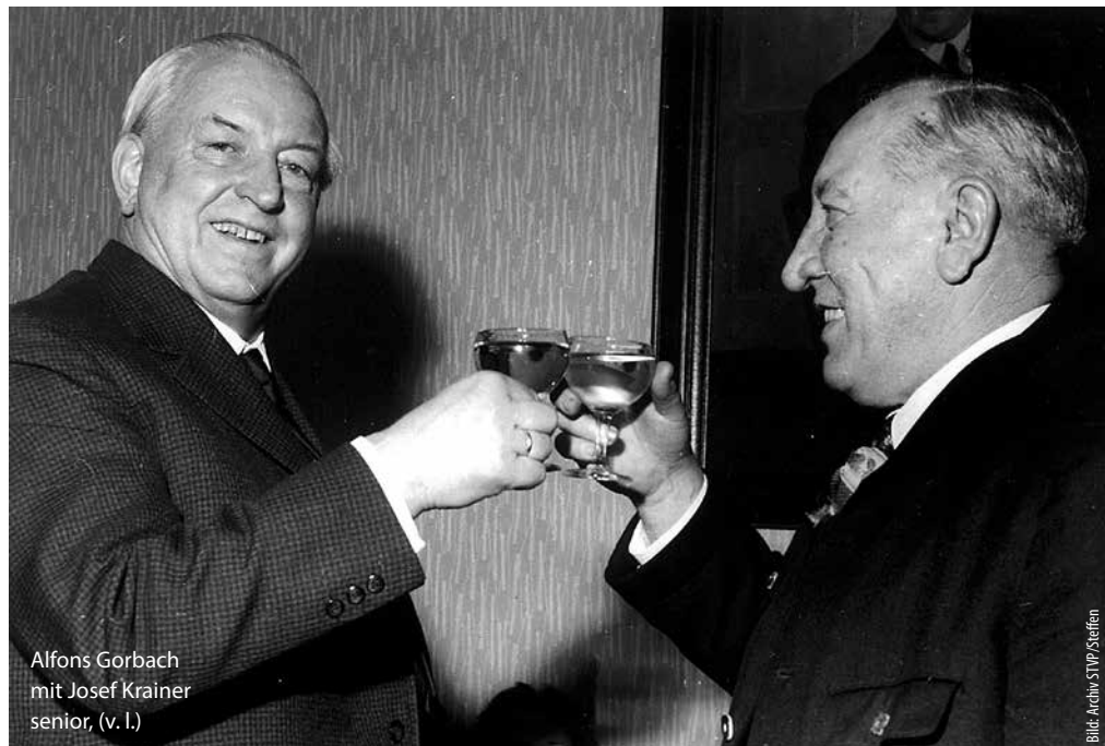
Alfons Gorbach mit Josef Krainer senior, (v. l.)