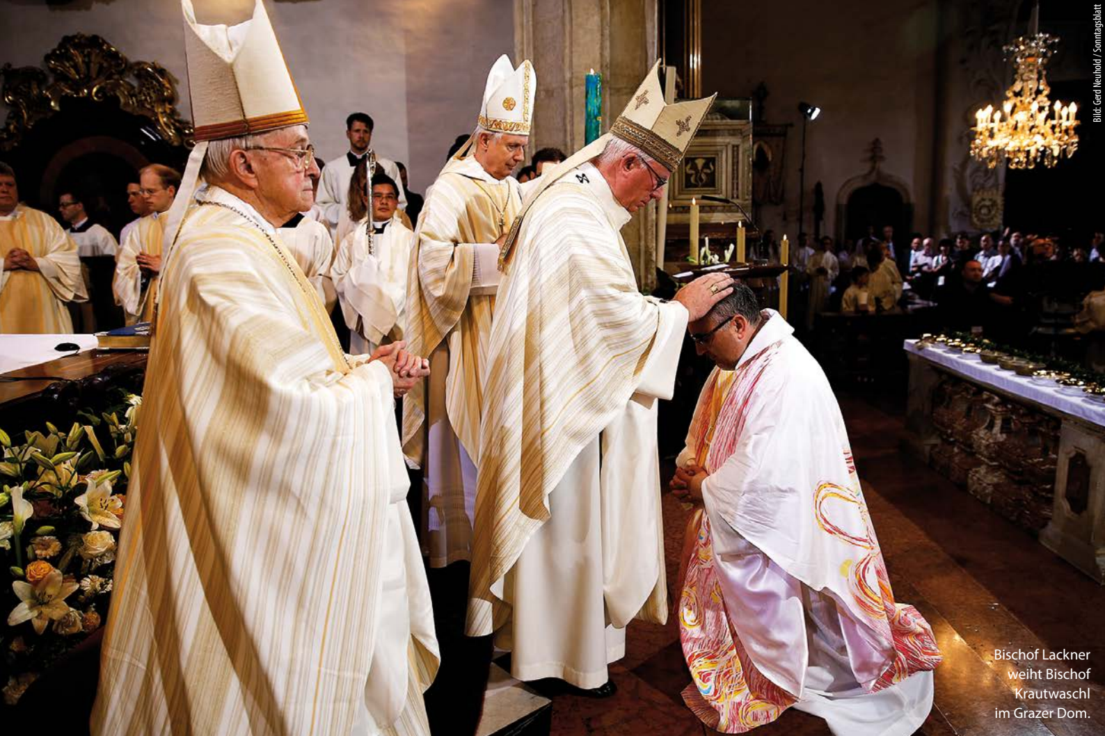
Bischof Lackner weiht Bischof Krautwaschl im Grazer Dom.