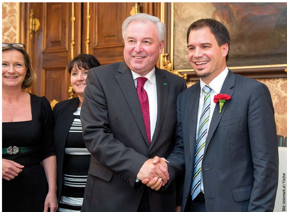
Handschlag von LH Schützenhöfer mit LH-Stv. Schickhofer vor der 1. Landtagspräsidentin Vollath und der 2. Landtagspräsidentin Khom

Schickhofer mit den Worten: „Bündeln wir die Kräfte und gestalten wir gemeinsam die Zukunft der Steiermark. Glück Auf!“