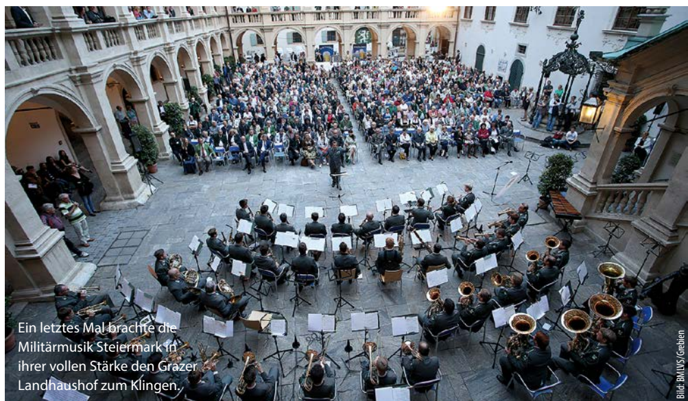
Ein letztes Mal brachte die Militärmusik Steiermark in ihrer vollen Stärke den Grazer Landhaushof zum Klingen.