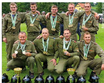
Landessieger Falkenstein in der Königsdisziplin Bronze A und Landessieger in der Klasse Silber A.

Landessieger in der Königsdisziplin „Bronze A“ wurde die Bewerbungsgruppe Falkenstein aus dem Bezirk Weiz, die