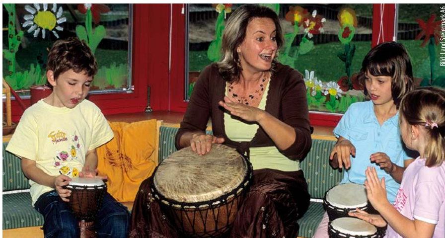
Bis 2017 werden insgesamt 4000 neue Betreuungsplätze geschaffen.