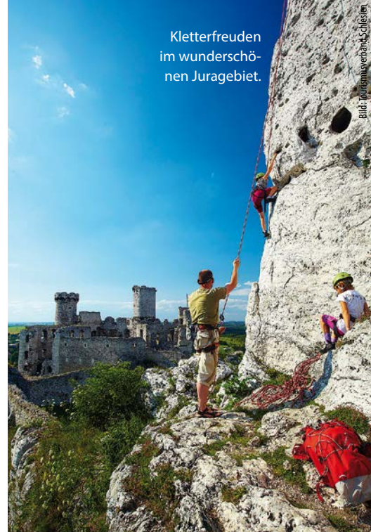
Kletterfreuden im wunderschönen Juragebiet.

Die Zauberworte „post industrial tourism“ hört man in Katowice und Umgebung auf Schritt und Tritt. Ehemalige Industrieanlagen wie das „Kohlebergwerk Guido“ in Zabrze oder die unter Denkmalschutz stehende Arbeitersiedlung „Nikiszowiec“, die beide Teil der „Route der Technischen Denkmäler“ sind, werden zu Tourismusmagneten umfunktioniert. Und viele neue Attraktionen sind buchstäblich auf alten Industrieruinen gebaut. Wie beispielsweise das prestigeträchtige Schlesiensmuseum, das erst im Juni mitten in Katowice eröffnet wurde. Entworfen vom Grazer Architektenduo Riegler Riewe erfüllt es ein stillgelegtes Bergwerk mit neuem Leben. Und wie: Alleine seit der Eröffnung im Juni bis Ende August konnten 100.000 Besucher begrüßt werden. Es besticht neben seinen Exponaten und geschichtlichen Sonderausstellungen auch durch spannende moderne Architektur. Letzteres gilt ebenso für die neue Konzerthalle, die aufgrund ihrer phänomenalen Akustik zu den besten Konzertsälen Europas zählen