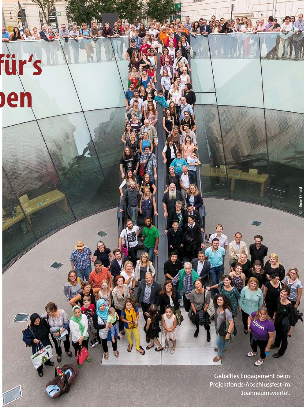
Geballtes Engagement beim Projektfonds-Abschlussfest im Joanneumsviertel.