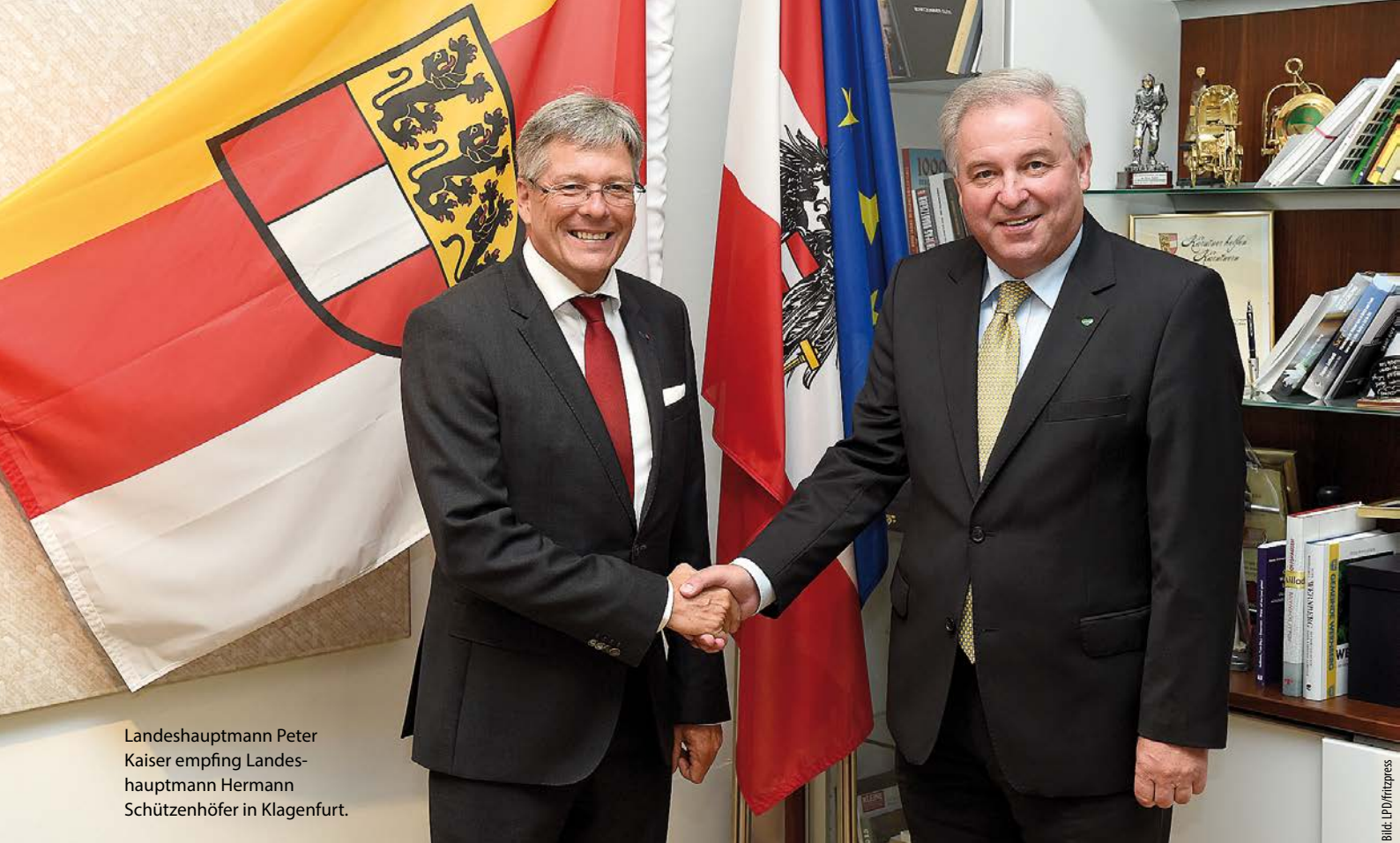
Landeshauptmann Peter Kaiser empfing Landeshauptmann Hermann Schützenhöfer in Klagenfurt.