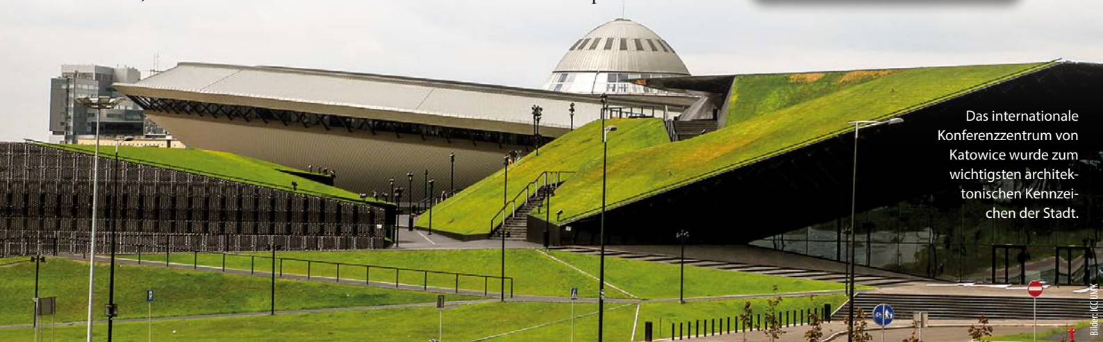
Das internationale Konferenzzentrum von Katowice wurde zum wichtigsten architektonischen Kennzeichen der Stadt.