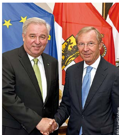
Landeshauptmann Hermann Schützenhöfer war zu einem Arbeitsgespräch bei Landeshauptmann Wilfried Haslauer.

Beim intensiven Austausch mit dem Kärntner Landeshauptmann Peter Kaiser wurde dabei speziell die Zusammenarbeit im Bereich der Gesundheitsversorgung oder bei Forschung und Entwicklung gefestigt, sowie die Übereinstimmung getroffen, neue gemeinsame Perspektiven zu entwickeln. Eine wichtige Rolle spielt dabei – nicht zuletzt auch durch die Beteiligung des Landes Kärnten am Joanneum Research – der gesamte Forschungs- und Entwicklungsbereich. Ziel ist die weitere Stärkung der Achse Steiermark-Kärnten und damit in weiterer Folge die Schaffung neuer Arbeitsplätze in diesem zukunfts-trächtigen Sektor. In diesem Zusammenhang betonte LH Schützenhöfer, dass jedenfalls davon auszugehen sei, dass die Koralmbahn beziehungsweise die Baltisch-Adriatische Achse die Wirtschaft im Süden Österreichs beleben werde. Aber auch die Verwal-