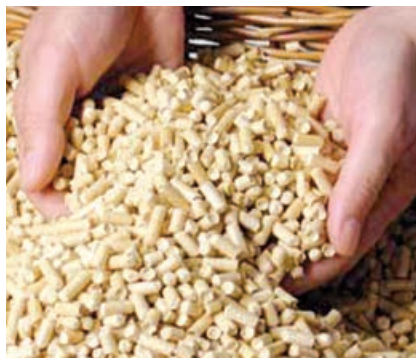
Unter den zahlreichen Einsatzmöglichkeiten für erneuerbare Energie haben sich die Pellets einen der Spitzenplätze am Markt erobert.