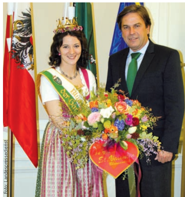
Die regierende Blumenkönigin Jasmin I überraschte LH Mag. Franz Voves mit einem bunten Blumengruß zum Valentinstag.

Anlässlich des Besuches zum Valentinstag dankte Tourismusreferent Landeshauptmann-Stellvertreter Hermann Schützenhöfer der Delegation der Gärtner und Floristen für die besonderen Leistungen im steirischen Tourismus: Mehr als 35.000 Steirerinnen und Steirer nahmen vergangenes Jahr am 49. Landesblumenschmuckbewerb teil. „Ihnen ist es zu verdanken, dass die Steiermark jedes Jahr in einem farbenprächtigen Blumenmeer erblüht und dadurch zum Blumenland Nr. 1 in Österreich geworden ist“, freute sich Landestourismusreferent Schützenhöfer.