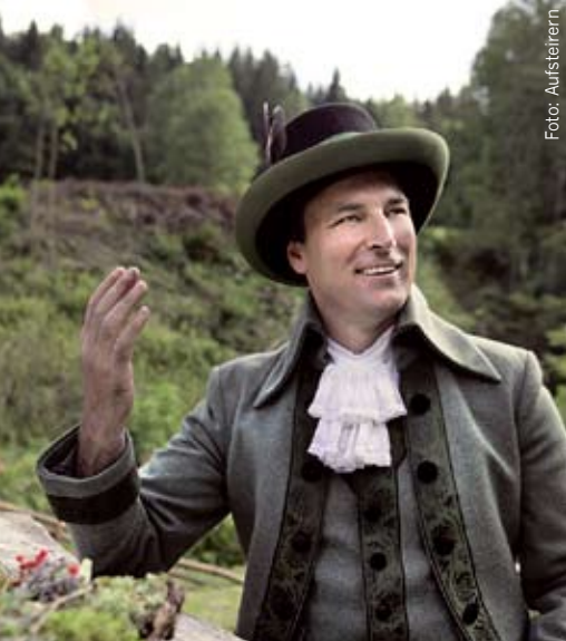
Der Erzherzog Johann steht im Mittelpunkt des heurigen „Aufsteirerns“.