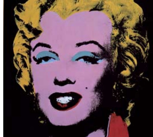
Andy Warhol, Licorice Marilyn, 1962