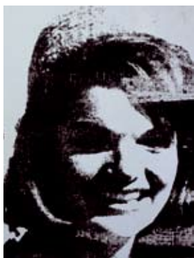
Andy Warhol, Jackie, 1964

Fast alle Steirerinnen und Steirer haben sie schon irgendwo einmal gesehen: die grellen Vervielfältigungen der Campbell-Suppendosen oder die berühmten Repro-Porträts von Marilyn Monroe oder Elvis. Kaum jemand hat die