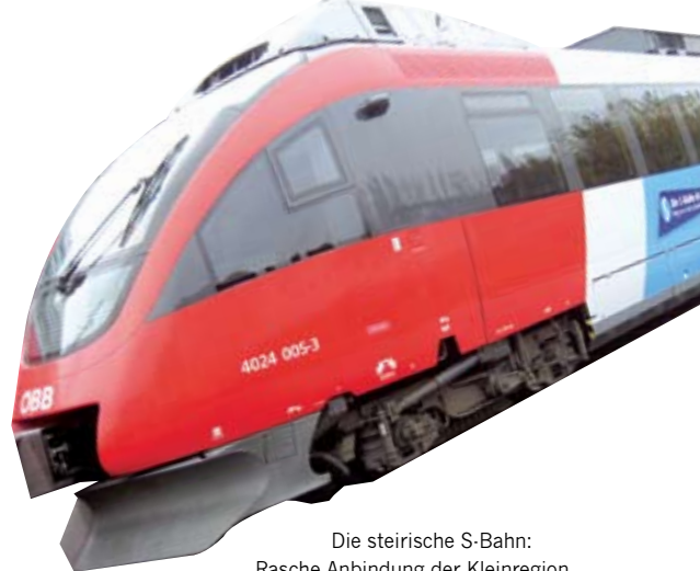
Die steirische S-Bahn: Rasche Anbindung der Kleinregion Übelbachtal an den Großraum Graz.

rischen Projekt der interkommunalen Zusammenarbeit „Regionext“, das die beiden Regierungsparteien gemeinsam beschlossen haben, können wir diesen internationalen Herausforderungen gerecht werden und gleichzeitig den BürgerInnen auch in der Zukunft Heimat in ihrer angestammten Region bieten“, sagt Landeshauptmann Mag. Franz Voves.