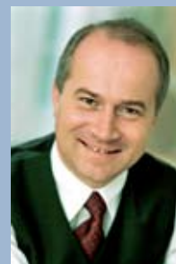
Landesrat Johann Seitinger

Aufs Wasser muss man aufpassen! Das ist nicht nur eine alte Weisheit, es ist – wenn man so will – auch das am kürzesten formulierte politische Programm des steirischen Wasserlandesrates. Das Wasser als unsere wichtigste Ressource zum Leben ist zum einen der größte weiß-grüne Reichtum, zum anderen zeigen gerade auch die Hochwasserereignisse dieses Sommers, welche Gefahren von ihm ausgehen können.