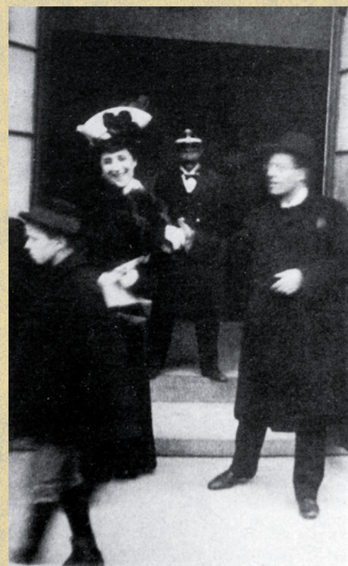
Der Wiener Hofoperndirektor Gustav Mahler verlässt nach einer Probe seiner dritten Symphonie die Grazer Oper.