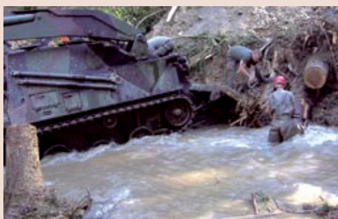
Unten: Schützenpanzer im Einsatz beim Lösen von Verkläuerungen in Hochwasser führenden Bächen.

unzählige Häuser vom Schlamm befreit. Die unglaubliche Arbeitsleistung der Soldaten entspräche einem Gegenwert von rund 7,5 Millionen Euro – der moralische Wert ihrer Unterstützung dürfte aber für die von den verheerenden Hochwässern Betroffenen wohl kaum in Geldsummen aufzuwiegen sein.