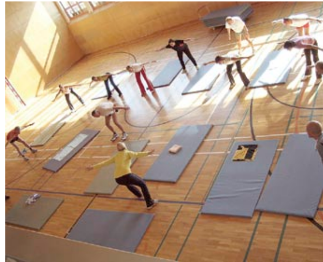
Ausbildung von ÜbungsleiterInnen für das Projekt „Gemeinde aktiv“.

Weiters stellt die Landessportorganisation den Schulen sechs Stunden mit externen Trainern zur Verfügung. Das neueste Projekt der Initiative, „Schule aktiv GTS“, setzt sich die Bewegungsförderung in der Nachmittagsbetreuung mit Hilfe eines