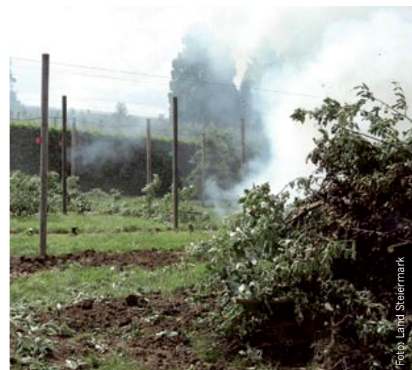
Bei starkem Feuerbrandbefall ist die Rodung von Erwerbsobstanlagen notwendig.

eine Bestätigung des Landes, um Streptomycin überhaupt beziehen zu können. Und auch dann war das Antibiotikum zum Einsatz nur freigegeben, wenn der Warndienst, dessen Meldungen täglich abrufbar waren, die höchste Gefahrenstufe ausgab.“ In einem Online-Verwaltungssystem hatte jeder Landwirt die Anwendung des Pflanzenschutzmittels binnen zwei Tagen zu melden. Die registrierten Standorte der Obstbaubetriebe sowie die großteils erfassten Bienenstände waren zuverlässige Parameter für das Rückstandsmonitoring bei Obst und Honig. Das Resultat dieser Maßnahmen: 2009 hat man im Honig keine Spuren von Streptomycin gefunden und Josef Pusterhofer geht davon aus, dass sich heuer auch beim Obst ein „Nullergebnis“ ausgehen könnte.