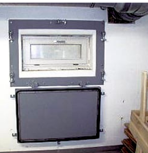
Hochwassersichere Kellerfenster bieten absoluten Schutz vor den Wassermassen.

Der Einbau von Rückstauklappen im Kanalsystem, die entweder außer- oder innerhalb des Gebäudes angebracht werden können, ist jedenfalls zu empfehlen. Ansonsten kommt es durch die Überflutung des Kanalsystems zum Rückstau des öffentlichen Kanalsystems in den Keller und tiefliegende Sanitärgegenstände bzw. Abflüsse werden überschwemmt. Im Allgemeinen sollte darauf geachtet werden, dass möglichst wenige Gegenstände und Installationen, vor allem elektrische, am Boden oder in Bodenhöhe sind. Überhaupt sollten Kellergeschosse und hochwassergefährdete Räume unbedingt einen eigenen Stromkreis bekommen. Schließlich kann nur so verhindert werden, dass das gesamte Gebäude eine Zeitlang stromlos ist und daher unter Umständen auch Pumpen nicht betrieben werden können.