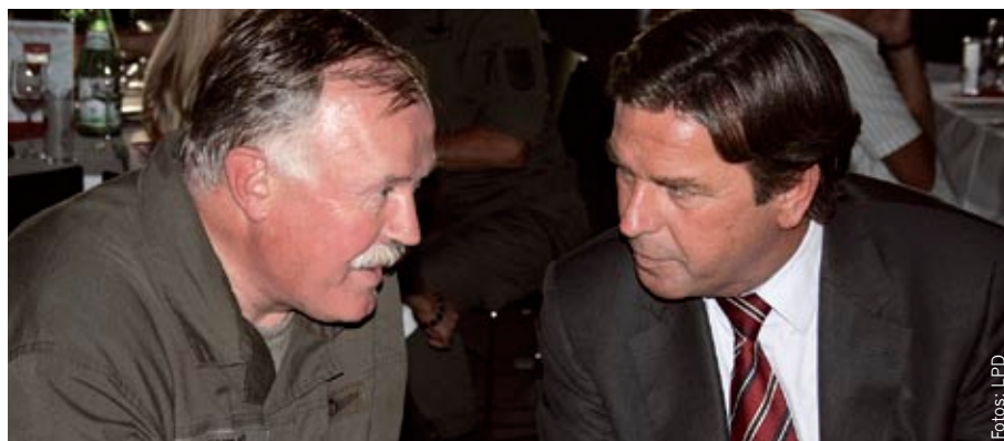
Eine gute Gesprächsbasis zwischen Bundesheer und Land Steiermark: General Mag. Edmund Entacher im Gespräch mit Landeshauptmann Mag. Franz Voves.