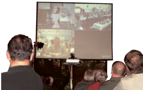
Per Videoschaltung mit mehreren Standorten verbunden: Das Bundesheer zeigte, was im täglichen Betrieb bereits Standard ist.

Landeshauptmann Mag. Franz Voves zeigte sich beeindruckt von den Leistungen des Bundesheeres und lobte im Besonderen die Einsatzbereitschaft bei den jüngsten Katastropheneinsätzen: „Wir alle können uns hier in der Steiermark nur zu gut an die Hochwasserkatastrophen dieses Sommers, an die Sturmkatastrophen „Emma“ und „Paula“ oder an die Schneekatastrophe in Mariazell erinnern. Zwar fällt die Bewälti-