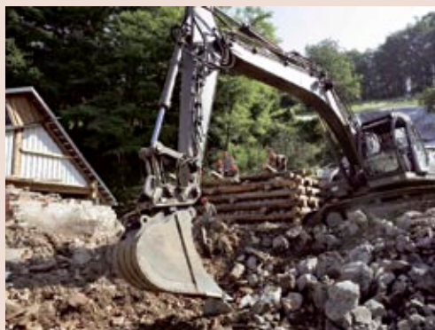
Oben: Die Einsatzkräfte errichten Schutzwände im Hochwassergebiet.

„E in großer Dank gilt den Assistentenkräften, die vor wenigen Wochen die bisher größte Katastrophenhilfe des Bundesheeres in der Steiermark beendeten“, so LH Voves. Seit Ende Juni leisteten Soldaten aus fünf Bundesländern an 83 Einsatztagen insgesamt 155.000 Arbeitsstunden zur Beseitigung der Hochwasserschäden. An 64 Schadensstellen in sieben steirischen Bezirken haben sie unter anderem acht Brücken gebaut, große Schutzwände errichtet und