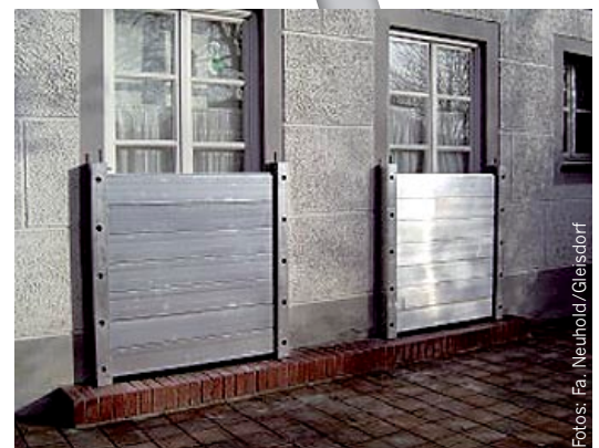
Die mobilen Schutzelemente werden im Notfall in die fix montierten Halterungen schnell und einfach eingesetzt.

Kommt es zu einer Überflutung der Kellerräume bei Altbauten, ist unbedingt zu beachten, dass ein schnelles Absenken des Wasserspiegels durch leistungsstarke Pumpen zum Problem werden könnte. Sobald nämlich das Wasserniveau innerhalb der betroffenen Räumlichkeiten absinkt, verringert sich der Druck auf die Außenwände