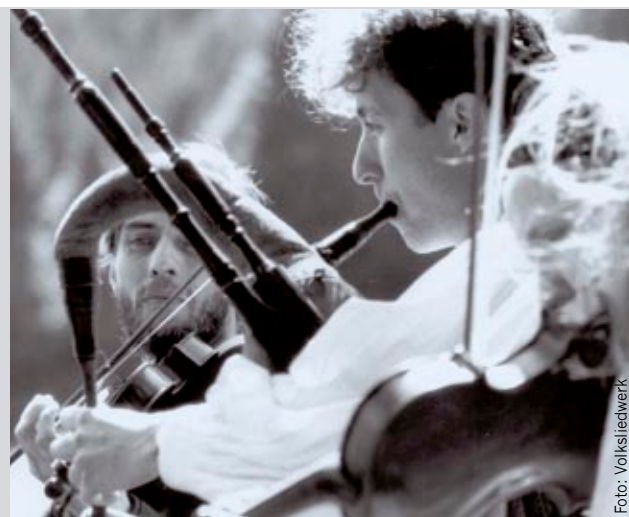
Man muss nicht mehr nach England fahren, um Dudelsack-Klänge zu hören

Links: Die ansprechende Fassade der Heimatwerk-Geschäftsstelle in der Sporgasse.