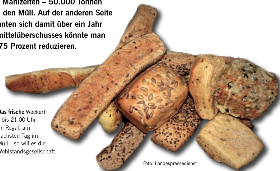
Das frische Weckerl – bis 21.00 Uhr im Regal, am nächsten Tag im Müll – so will es die Wohlstandsgesellschaft.

Statistisch gesehen, verdient jeder Bürger der Steiermark 17.551 Euro pro Jahr (Median-Äquivalenzeinkommen). Laut Armutsdefinition erhalten armutsgefährdete Personen weniger als 60 Prozent davon – also rund 10.531 Euro. Sie haben im Durchschnitt monatlich um rund 132 Euro zu wenig. Das zu ändern, würde knapp 215 Millionen Euro pro Jahr kosten. „Dem gegenüber stehen der Wert pro Jahr weggeworfener Lebensmittel von 150 Millionen Euro und deren Entsorgungskosten von mehr als acht Millionen“, sagt der Leiter der Abteilung 19D (Abfall- und Stofffluss-