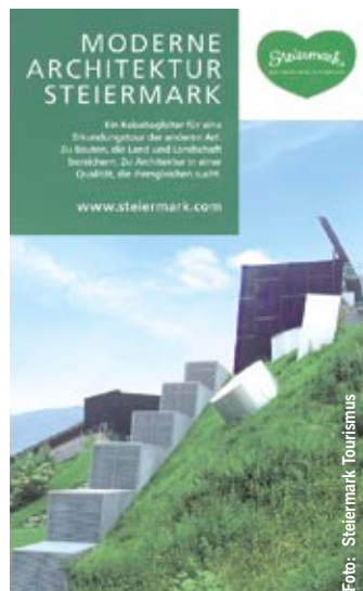
Alle Broschüren erhältlich bei Steiermark Tourismus (0316/4003) oder im Internet.

Moderne Architektur Steiermark: Der kostenlose Folder mit 63 der schönsten modernen Weinkeller, Museen, Hotels, Thermen, Aussichtsplattformen, Kirchen und Schulen vom Dachstein bis ins Weinland mit Bild und Beschreibung.