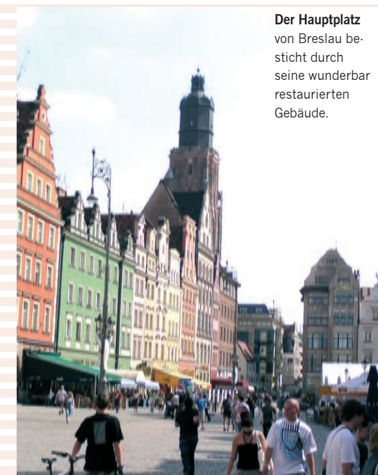
Der Hauptplatz von Breslau besticht durch seine wunderbar restaurierten Gebäude.

sprochen freundlich. Mit der unbrauchbaren Wegskizze aus dem Internet am Armaturenbrett – leider beim GPS gespart und keine Polen-CD gekauft – auf vergeblicher Camapanile-Suche, erbarmt sich sofort eine nette polnische Mutter der Fremden aus Österreich, schnallt ihr Kleinkind auf den Kindersitz im Fonds und fährt mit ihrem Auto voraus zum Hotel an der Oder (Odra). Der Fluss ist es, der die Stadt bestimmt. Mit ihren zahlreichen Kanälen und Nebenarmen hat die Oder Breslau zum Venedig Schlesiens werden lassen. Nur ein paar Worte zur stimmungsvollen Altstadt: Kaum zu fassen, dass 80 Prozent der Häuser im Kampf um Breslau 1945 zerstört waren. Großartig, was Polen im Wiederaufbau geleistet hat. Jetzt besticht die Stadt mit einem Ambiente, das den Besucher verzaubert. Am besten infahren.