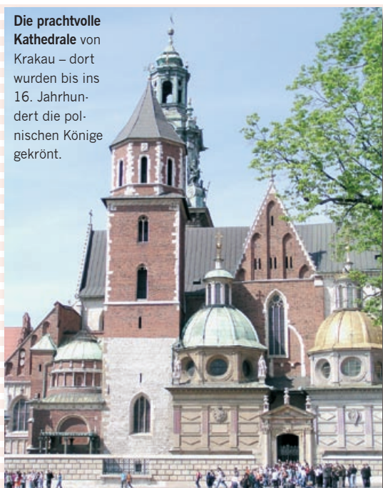
Die prachtvolle Kathedrale von Krakau – dort wurden bis ins 16. Jahrhundert die polnischen Könige gekrönt.

Besucher den sanften Druck aus, immer wieder zu kommen. Der Burgberg Wawel als ehemaliger Sitz der polnischen Könige und seine Kathedrale, der Rynek, mit seinen 220 mal 220 Metern größter Hauptplatz in Mitteleuropa, die Plantys als Grünring um die historische Altstadt, die Marienkirche mit dem 13 Meter hohen Veit Stoß-Altar als sichtbare Machtdemonstration der wohlhabenden Bürgerschaft gegen „die da oben“ am Wawel. Und wer im Keller des alten Stadttheaters das „Maska“ entdeckt, darf sich schon als Krakau-Insider bezeichnen. Dort kann man zum Beispiel sogar – kein verspäteter Aprilscherz – die steirischen Landesfarben trinken. „Steiermark? Kein Problem“, zeigt sich der deutsch sprechende Oberfachkundig und bringt ein Likörglas, unten grün gefüllt, konturenscharf darüber weiß. „Österreich für die Dame?“ Rot-weiß-rot im Glas, man muss die Liköre nur vorsichtig einschenken. Die Steiermark schmeckt piktsüß, Österreich auch.