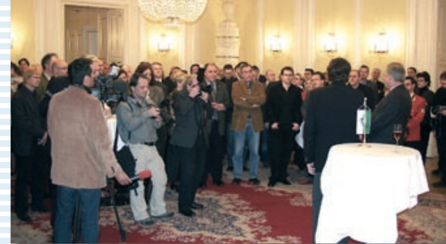
Gemeinsam hießen diesmal LH Franz Voves und sein Stellvertreter Hermann Schützenhöfer die Gäste im Weißen Saal der Grazer Burg willkommen. Einhelliger Tenor: Super, bitte nächstes Jahr wieder so.