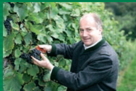
Als Erntehelfer im Einsatz: Agrarlandesrat Johann Seitinger.

Landwirtes auch als Energiewirt und die Aus- und Weiterbildung der jungen Hofübernehmer werden dabei wichtige Rollen einnehmen. Die Bauern entwickeln sich zunehmend als Universalunternehmer im ländlichen Raum“,