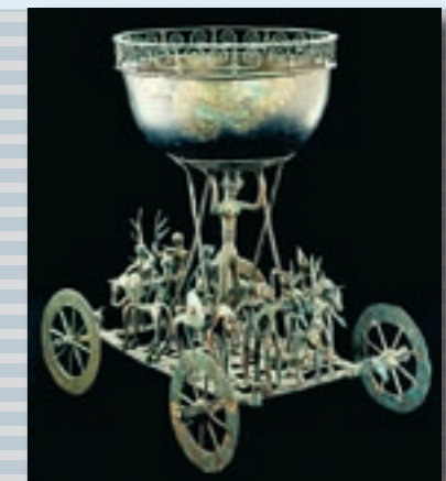
Der Strettweger Kultwagen, ab Jänner 2008 wieder im Schloss Eggenberg zu sehen.

entschloss man sich, dieses wertvolle Prunkstück nicht mehr zu Ausstellungen außerhalb von Graz zu verleihen. Im Jahr 1954 verhängte der Steiermärkische Landtag sogar ein bis heute gültiges Transportverbot. Erst nach der Einholung zahlreicher Gutachten und Genehmigungen war jetzt unter strikter Geheimhaltung die Überführung von Graz nach Mainz möglich.