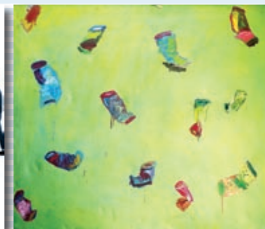
Wolfgang Becksteiner, Definierte Willkür, 2007 (li.)