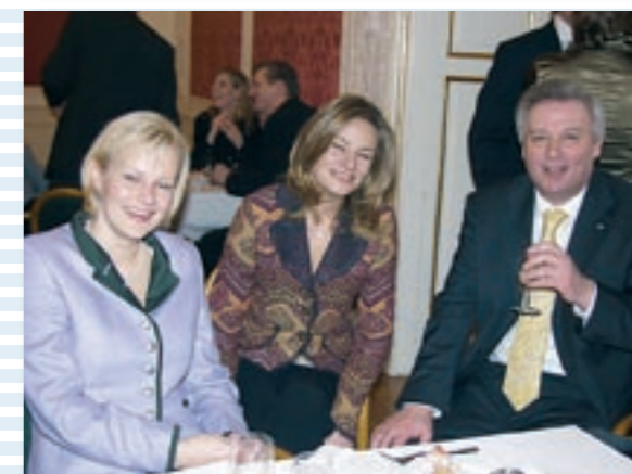
Die beiden ORF-Damen Renate Rosbaud und Sigrid Maurer mit LH-Stellvertreter Hermann Schützenhöfer.