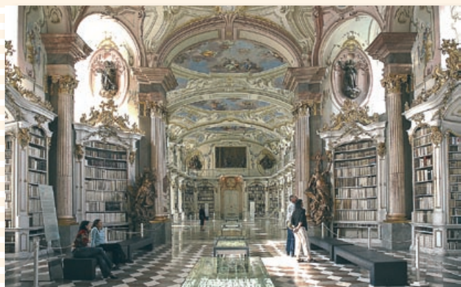
2008 wird die restaurierte Stiftsbibliothek in neuem Glanz erstrahlen.

Die größte Klosterbibliothek der Welt und das neue, mit dem österreichischen Museumspreis ausgezeichnete Großmuseum des Stiftes Admont, haben letztes Jahr 65.000 Menschen besucht. Bis 2008 werden die auch mit Landesmitteln geförderten Restaurierungsarbeiten an der Bibliothek abgeschlossen sein.