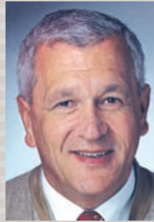
Dr. Dieter Rupnik Leiter des Landespressedienstes

E iniges wird Ihnen verändert vorkommen, wenn Sie diesen Steiermark Report im Internet unter >landespressedienst.steiermark.at< anklicken, der höchst augenfällige Unterschied zeigt sich allerdings in der Printausgabe. Erstmals ist es gelungen, mit Jänner 2007 den Steiermark Report auch im Druck durchgehend in vier Farben erscheinen zu lassen und das in einem neuen Layout.