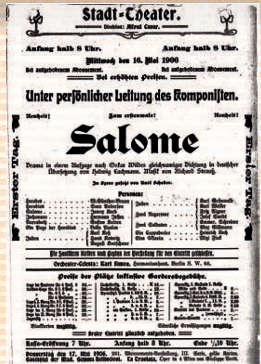
Der Theaterzettel der historischen Aufführung der Salome.